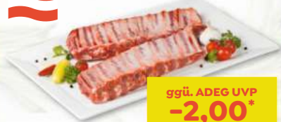
efef Spare Ribs natur in Bedienung per kg