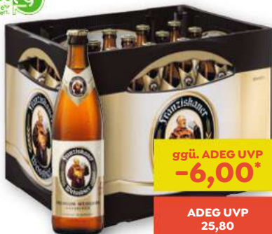
Franziskaner Weissbier 20 x 0,5 Liter

ggü. ADEG UVP -6,00* ADEG UVP 25,80 19,80 0.5 Liter 0.99