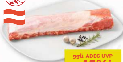
efef zartes Schweinskarree ohne Schwarte ohne Knochen in Bedienung per kg