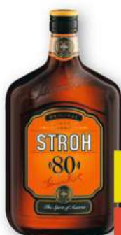
Rum Stroh 80% 0,7 Liter

ggü. ADEG UVP -4,50* ADEG UVP 24,49 19,99 1 Liter 28.56