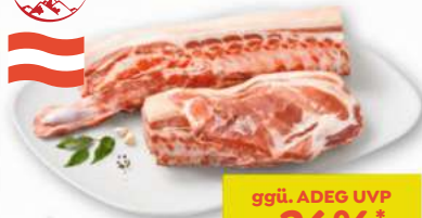
efef Schweinskarree mit Schopf wie gewachsen in Bedienung per kg