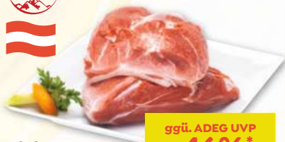
efef saftige Schweins- schulter mit Schwarte ohne Knochen in Bedienung per kg