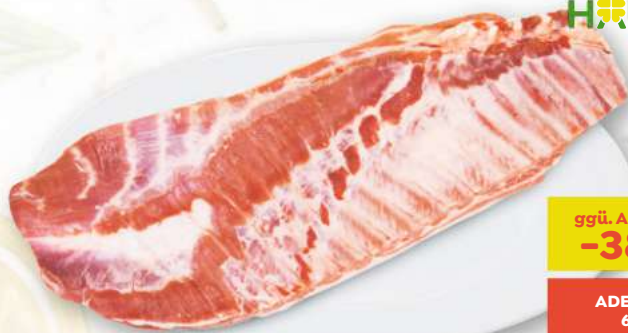
efef Schweinsbauch wie gewachsen in Bedienung, per kg